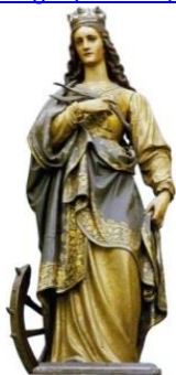
SANTA CATARINA DE ALEXANDRIA